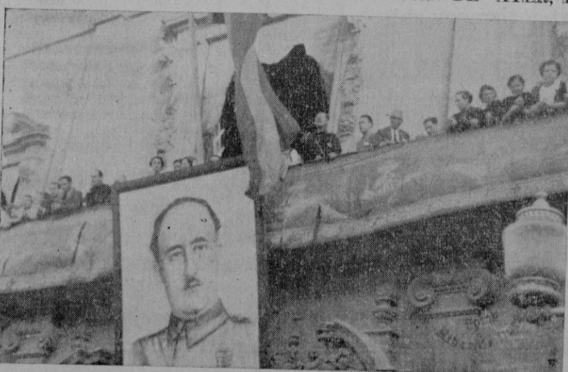
I. El Jefe Provincial de Falange Española Tradicionalista y de las J. O. N. S., hablando a la muchedumbre, desde el balcón de la Casa Consistorial. — II. El enorme gentío que llena la plaza de Cort escucha, brazo en alto, el Himno Nacional.

Desde hace bastante tiempo, se ha extraviado uno. Se agradecerá la devolución. Informes, en esta Administración.