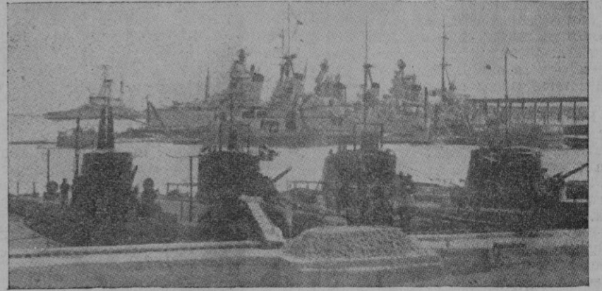
Submarinos y cruceiros italianos, anclados en el puerto de Nápoles para tomar parte en la gran revista naval de ayer en honor del Führer-Canciller de Alemania.

Porque esta generación de hoy es la generación de la guerra, el nos ha transformado; por lo tanto debemos colocarnos en nuestro papel ahora y saber luego darle un matiz nuevo, un matiz de mujer entera, de mujer de Falange, y que por lo tanto y por haber vivido esta guerra sabe de sufrimientos y de penas. Nosotras tenemos el timbre de la Juventud de hoy que es la base de la paz de mañana. ¡Bella misiva la nuestra! Somos el fundamento de la fuerza del hombre y debemos atizar siempre el fuego que mantenga viva la llama con el ejemplo y la vida. Luego, en el amanecer del mañana, no tendremos ya esa capa frívola y sensual que tantas muchachas han tenido hasta ahora; es imposible. La máscara se habrá desprendido para siempre y daremos a conocer al mundo entero cuanto vale