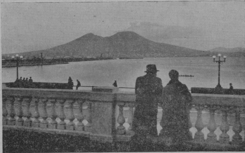
Un aspecto de la magnífica bahía de Nápoles — con el Vesubio al fondo — donde ayer se celebró la gran revista naval en honor del Führer-Canciller de Alemania.

Salamanca, 5 de Mayo de 1938 — II Año Triunfal. De orden de S. E. — El General Jefe de Estado Mayor, Francisco Martín Moreno