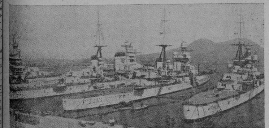
Cruceiros italianos de 10.000 toneladas, reunidos en el puerto de Nápoles para tomar parte en la gran revista naval de ayer en honor del Führer-Canciller de Alemania.

Los últimos días transcurridos, a pesar de que el tiempo no abonanza, las tropas de Castilla han avanzado, conquistando algunos pueblos, aunque no con ese ritmo de marcha triunfal con que empezaron estas operaciones. Se han cerrado algunas bolsas y se ha verificado el enlace entre las tropas de la izquierda con las del centro de este frente. Hasta