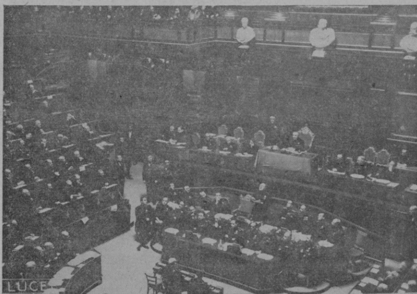
Roma. — Mussolini pronunciando su discurso en el Senado.

En la parte de arte decorativo hay que reconocer un gran esfuerzo que demuestra una inquietud de su espíritu artístico y un afán para hallar originalidad en la expresión por lo cual no consideramos que sea únicamente el espíritu decorativo el que informa todas las obras de dicha sección. Analizándolas vemos reminiscencias de las manifestaciones artísticas revolucionarias que, reaccionando contra el impresionismo aparecieron desde mediados del siglo pasado con los "simbolistas", "expresionistas", "ingénucos" y últimamente con "el cubismo" tendencias todas ellas necesarias seguramente para la