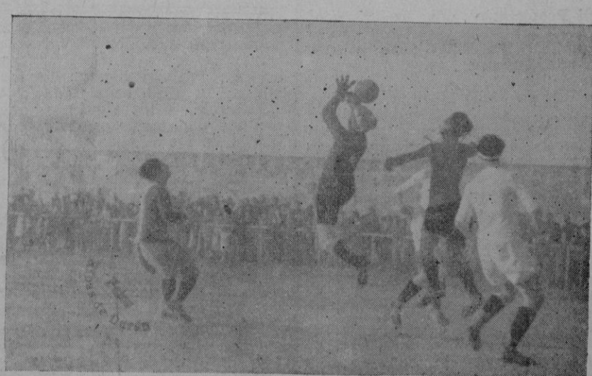
Una jugada del partido de ayer tarde, a beneficio de la juventud deportiva mallorquina que lucha en los frentes peninsulares