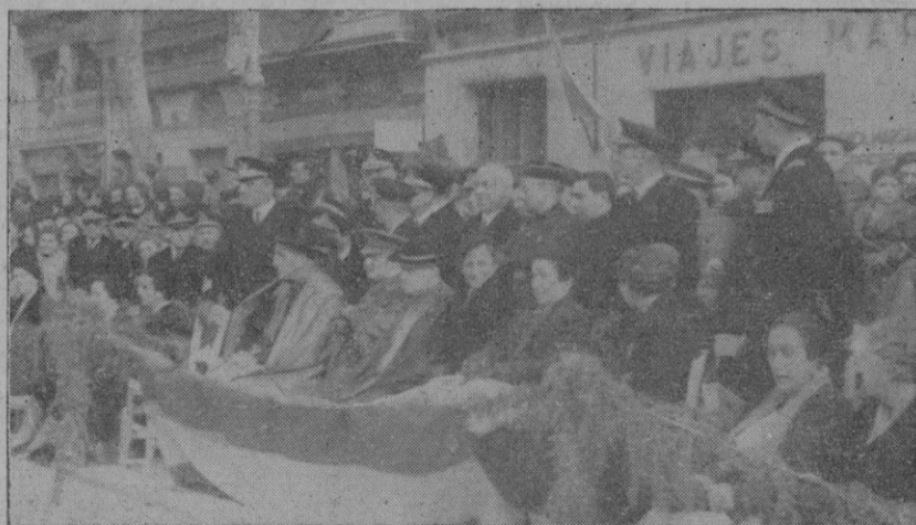
Las autoridades e invitados en la tribuna presidencial.

Un éxito grande de organización constituyó ayer el anunciado homenaje a la Marina Nacional, cuidadosamente desarrollado por la Sección Femenina de Falange Española Tradicionalista y de las J. O. N. S., a la cual por la brillantez de la fiesta no se le puede negar ningún elogio.