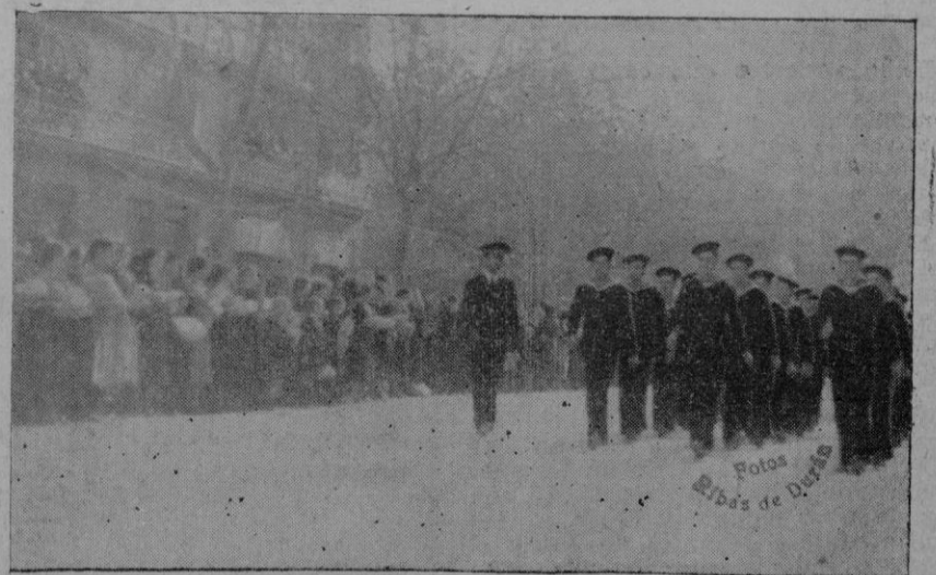
Un grupo de marinos al desfilar.

Amenizó la fiesta la banda de F. E. T. y de las JONS, tocando alegres canciones.