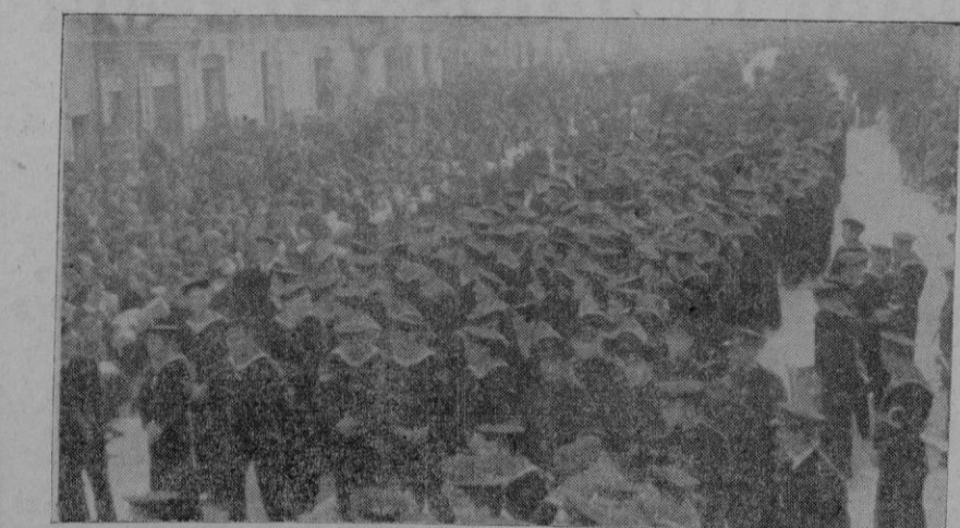
Los marinos, formados en el paseo del General Franco, y en frente, las falangistas sosteniendo los paquetes con sus regalos.