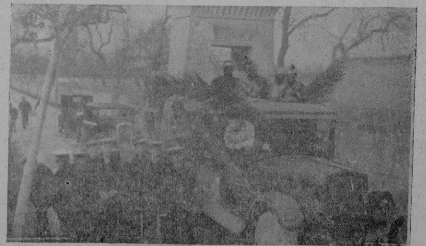
De la cabalgata de los Reyes Magos en Palma