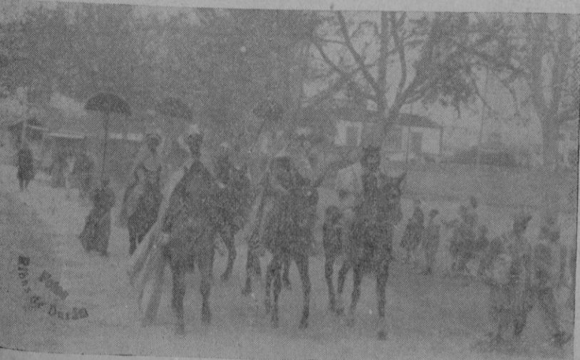
De la cabalgata de los Reyes Magos en Palma

Este número se publica con permiso de la Autoridad Eclesiástica