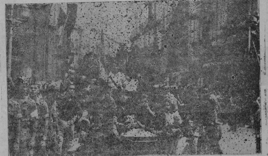
Un aspecto de la grandiosa manifestación patriótica de ayer