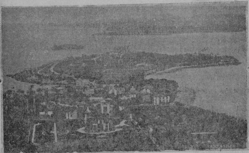
Santander. — La Península de la Magdalena

Poco a poco la plaza se llenaba totalmente de gente, que acudía a sumarse a la manifestación, siendo los primeros en llegar la Banda Municipal y nutridas representaciones de obreros y empleados de las fábricas de "Gas y Electricidad S. A." en número de 400, a cuyo frente iban los