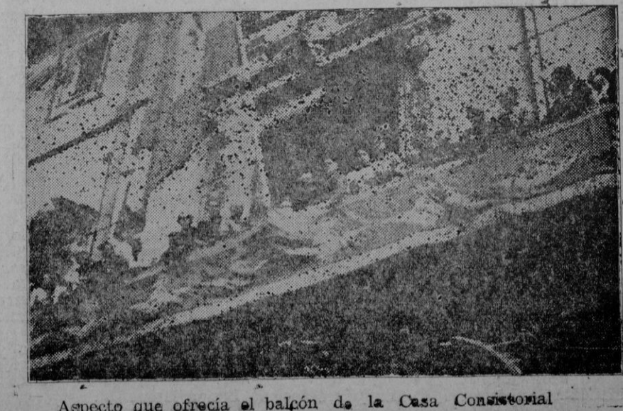
Aspecto que ofrecía el balcón de la Casa Consistorial