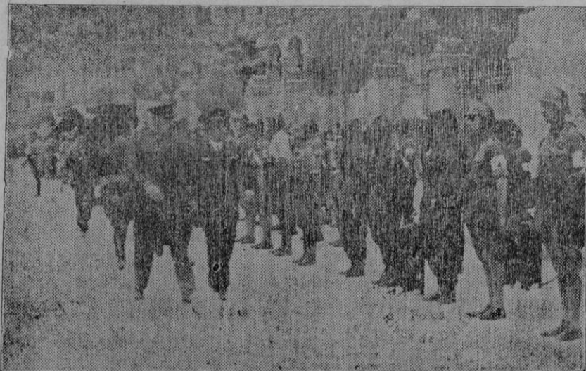
El Excmo. Sr. Comandante Militar revistando los elementos de la Defensa Pasiva Antiaérea

LA GRAN PARADA DE AYER DE LA DEFENSA PASIVA ANTIAEREA