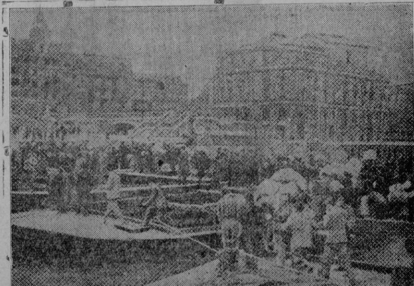
Bilbao. — Paso de evadidos por la pasarela tendida sobre el Nervión.