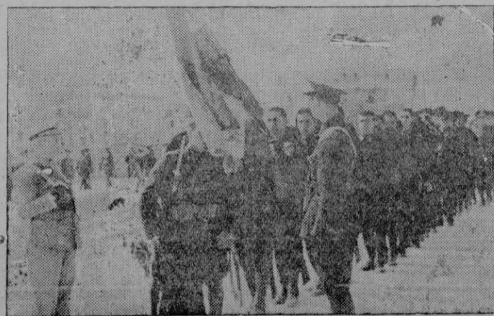
Momento de la jura de la bandera por la fuerza del Batallón de Infantería de Marina

—Si así lo hacéis — prosiguió el señor Montaner —, la Patria os lo agradecerá y premiará, y si, no mereceréis su desprecio y su castigo como indignos hijos de ella. ¡Soldados! termino diciendo — ¡Viva España!