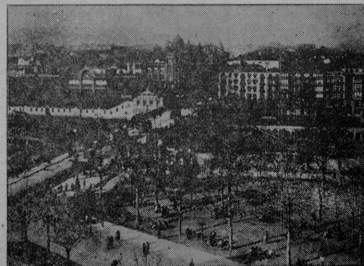
Bilbao. — Paseo del Arenal y puente sobre la ría