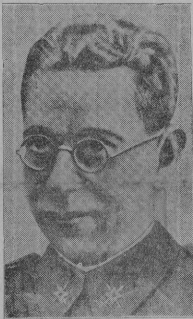
El glorioso General Mola, que tan admirablemente preparó la toma de Bilbao

Se desmiente rotundamente lo que la prensa roja viene diciendo de que cien aviones nacionales vuelan sobre la población sembrando el terror en la misma y matando mujeres y niños, siendo así que desde hace tres días no ha volado un solo avión sobre la población de Bilbao.