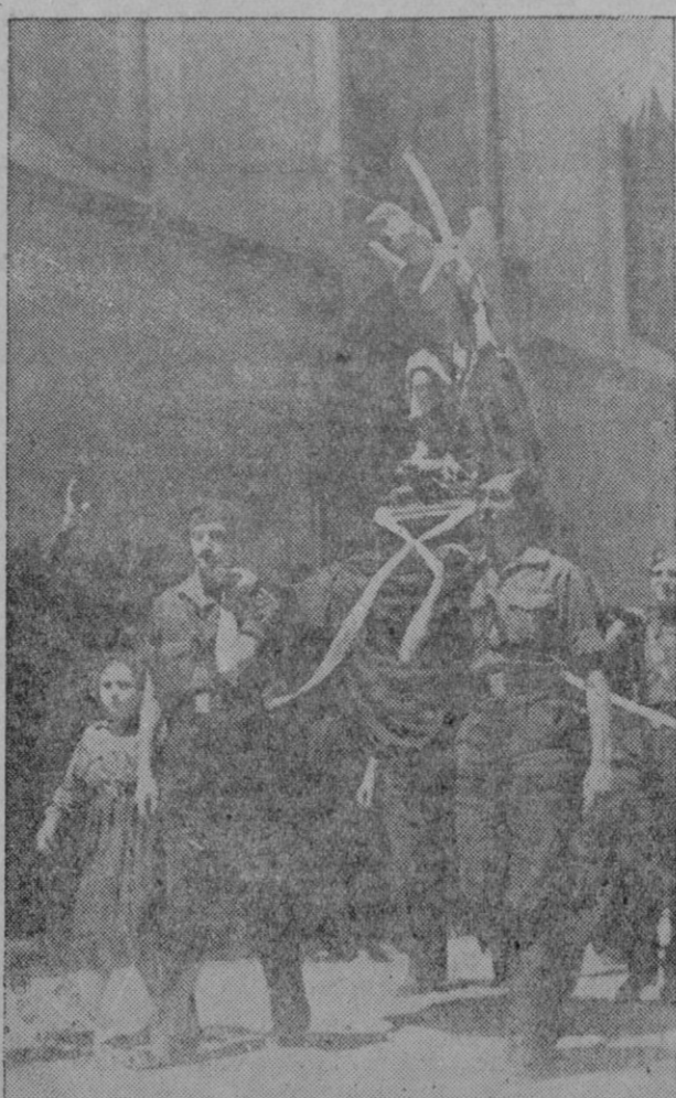
Imagen de San Miguel, benedicta el domingo, regalada por los feligreses de la parroquia del Santo Arcángel a F. E. T. y de las JONS

Está ya casi tocando a su fin este mes de Mayo, el mes de Ma-