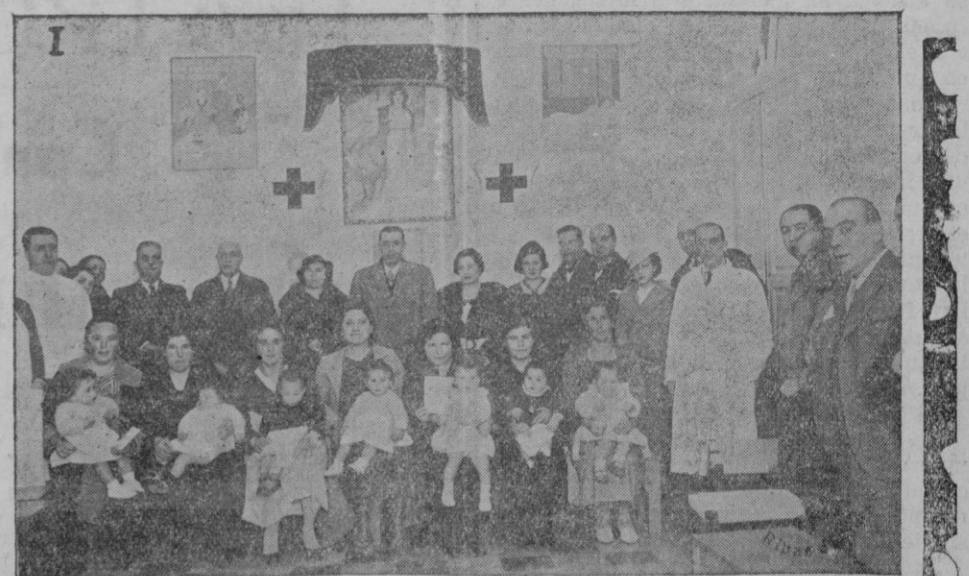
Las autoridades, con las madres de la Sección de Puericultura que recibieron el pasado sábado los premios a que se hicieron acreedoras.