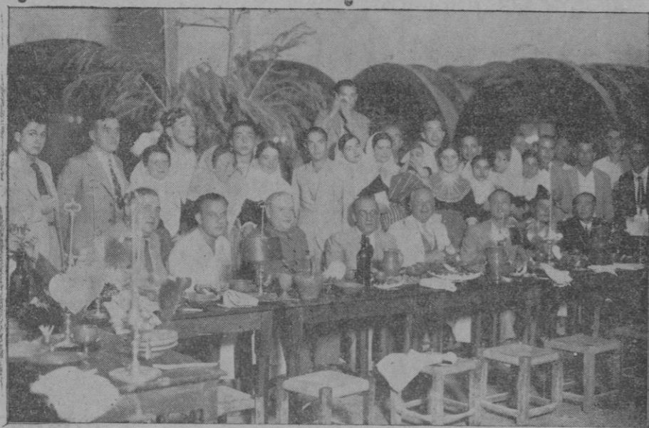
Artística fotografia del sopar típic mallorquí que es celebrà amb assistència del Sr. Governador i Autoritats en el celler típic de "Ca'n Amer" el dia del festival típic "Reinaxensa Mallorquina" organitzat per L'Art Vell d'Inca

Després, el senyor Governador i demés autoritats i el Jurat qualificador del certamen de balls anaren de cap a la Plassa de la República a presenciar el Gran Certamen de Balls Regionals, on s'hi havia composta una gran multitud de gent per presenciar l'acte. Enmig de la Plassa ja s'havien compost un bon estol de balladors i balladores, l'Agrupació de "L'Art Vell" i l'Agrupació Folklórica "Copeo de Selva", amb la seva orquesta que, unida amb sa de "L'Art Vell" amenitzaven el gran Certamen; sortí de lo millor; les dues agrupacions tregueren a rotlo els millors números dels seus repertoris. Tal volta semblant acte en cap poble de Mallorca té un simbolisme més vertader i entrenyable. Acabà el certamen a hora avançada de la nit.