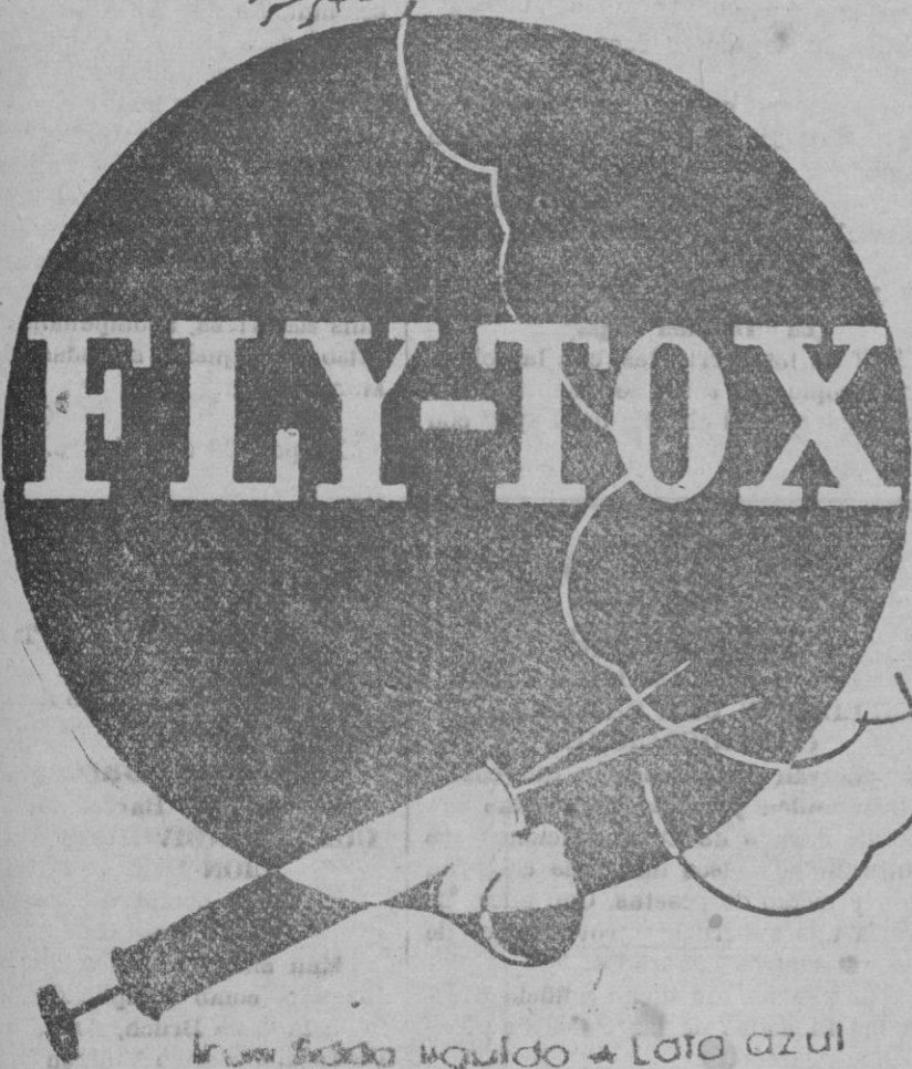
¡Limpia todo líquido con LOTO AZUL!

ESCRIBA HOY MISMO A LA EDITORIAL "LA HORMIGA DE ORO, S. A." — Apartado, 26, Barcelona — y recibirá gratis y sin compromiso, un número de muestra.