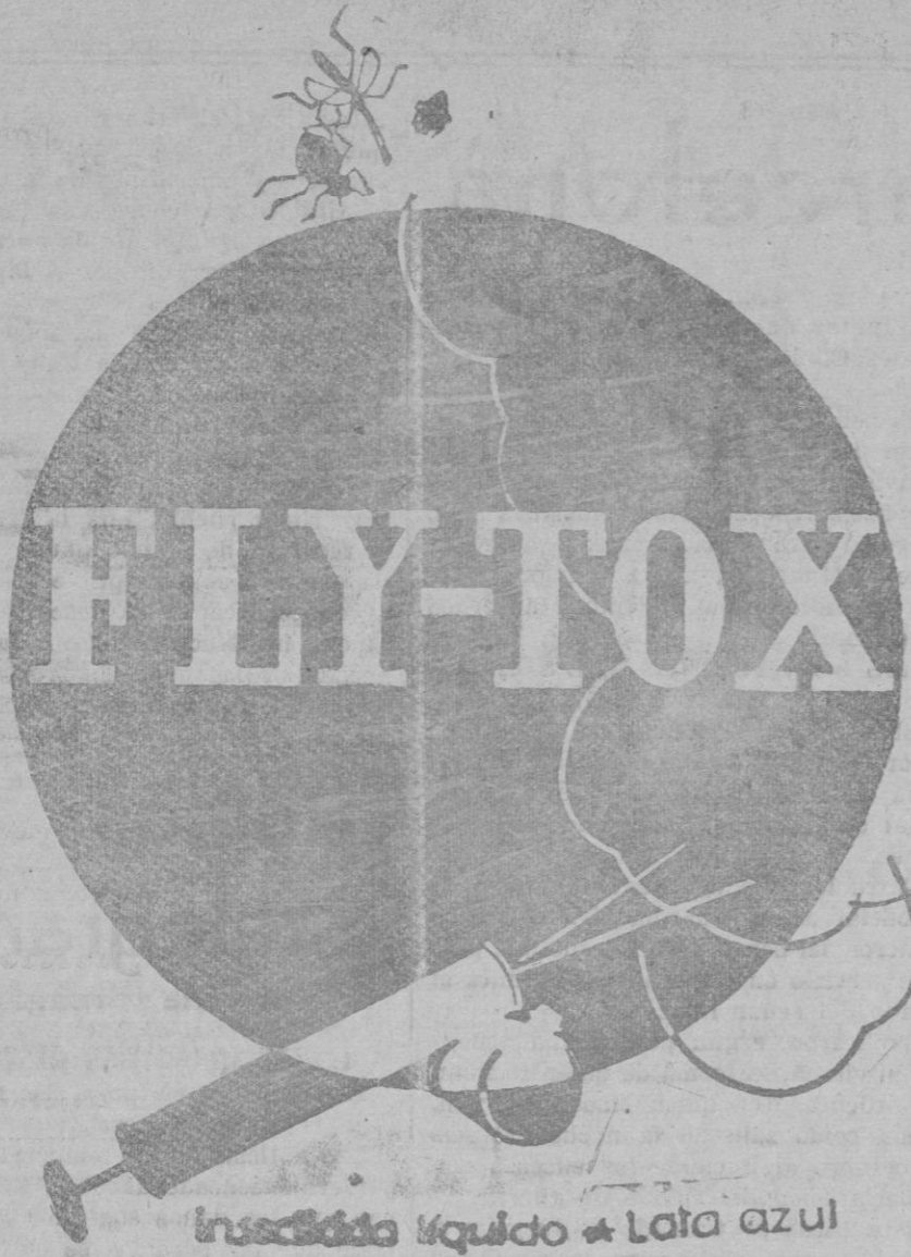
Insecticida líquido - Lata azul