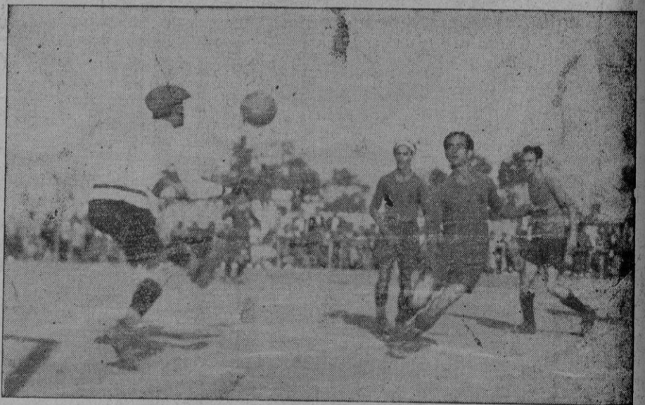
I. — El equipo del "Mediterráneo" que venció al del "Soledad" por 3 a 1. II. — El equipo del "Soledad" que fué batido por el del "Mediterráneo". III. — Un momento de peligro ante la puerta del "Mediterráneo". IV. — El portero del "Mediterráneo" bloqueando un balón.