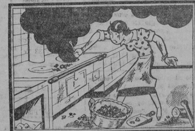
ELLA: Si no fuera por esta cocina la vida sería más agradable.

Alhajas de oro y plata Dentaduras usadas Monedas antiguas de oro, plata y cobre J. MIRÓ Sindicato, 4 (al lado de la chocolatería Bordy)