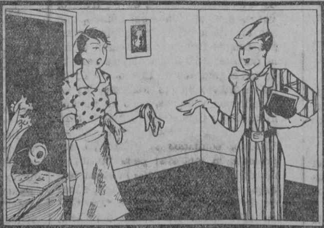
ELLA: Fíjate lo sucia que me encuentras, llevo rato batallando con la cocina. AMIGA: Por eso, yo aproveché la CAMPAÑA ANUAL DE GAS Y ELECTRICIDAD y tengo tiempo para todo