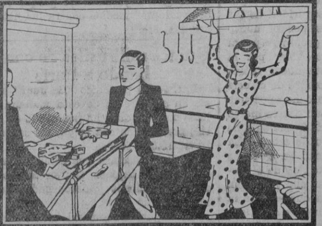
ELLA: ¡Al fin! Se acabó la suciedad Ahora cocinar será un encanto.