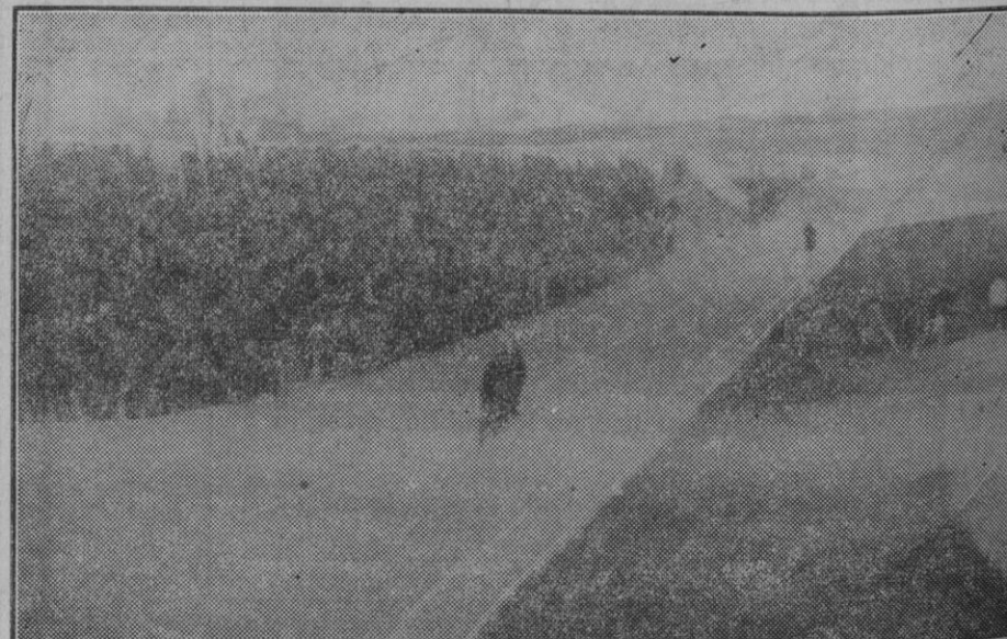
1 Momento de darse la salida a los corredores: éstos se disponen a "pegarse" a sus entrenadores. 2 Nicolau "dobla" por segunda vez a Planas. Los tres finalistas del Campeonato: Barceló, Planas y Nicolau (éste último es el señalado con el aspa). 4 Aspecto que ofrecía la tribuna de preferencia durante el transcurso de la carrera.