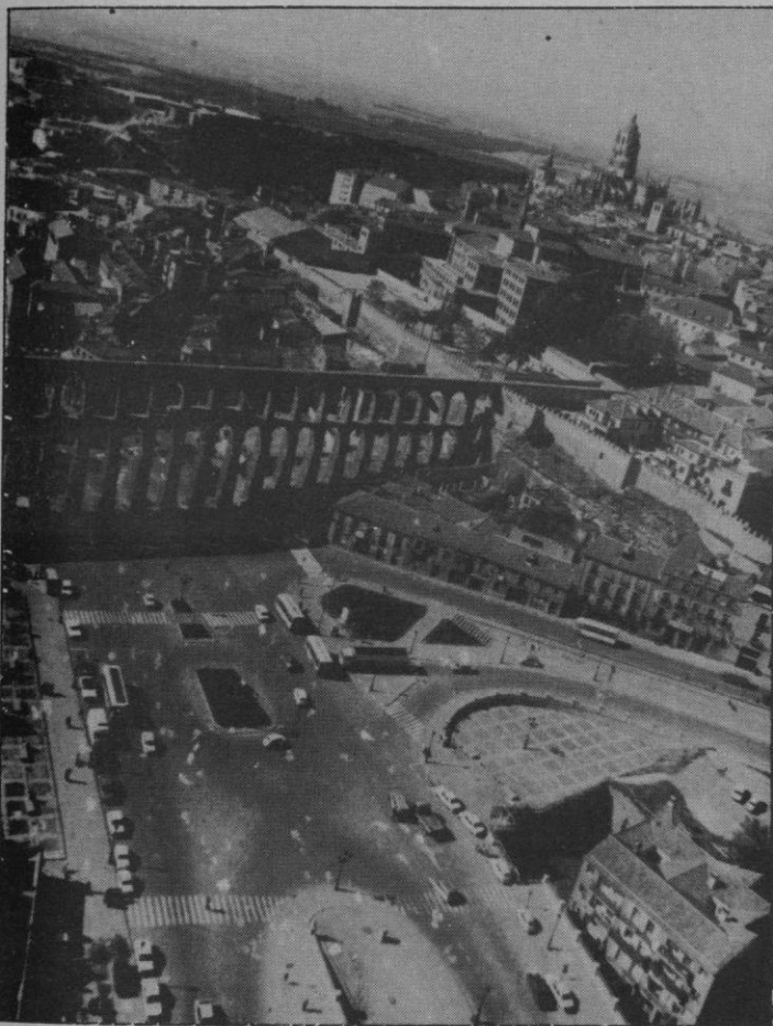
Las confluencias de diversas carreteras, implica a diversos organismos