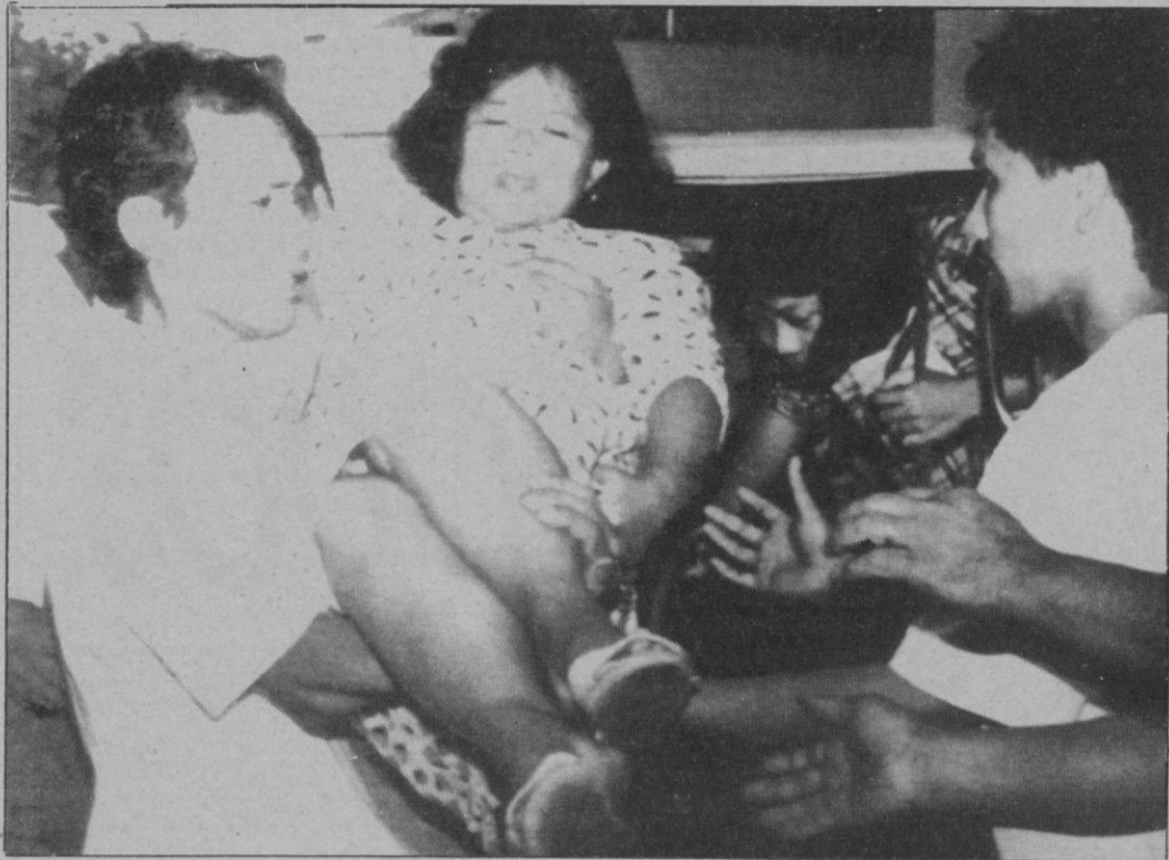
Una mujer herida es trasladada rápidamente a uno de los hospitales de urgencia