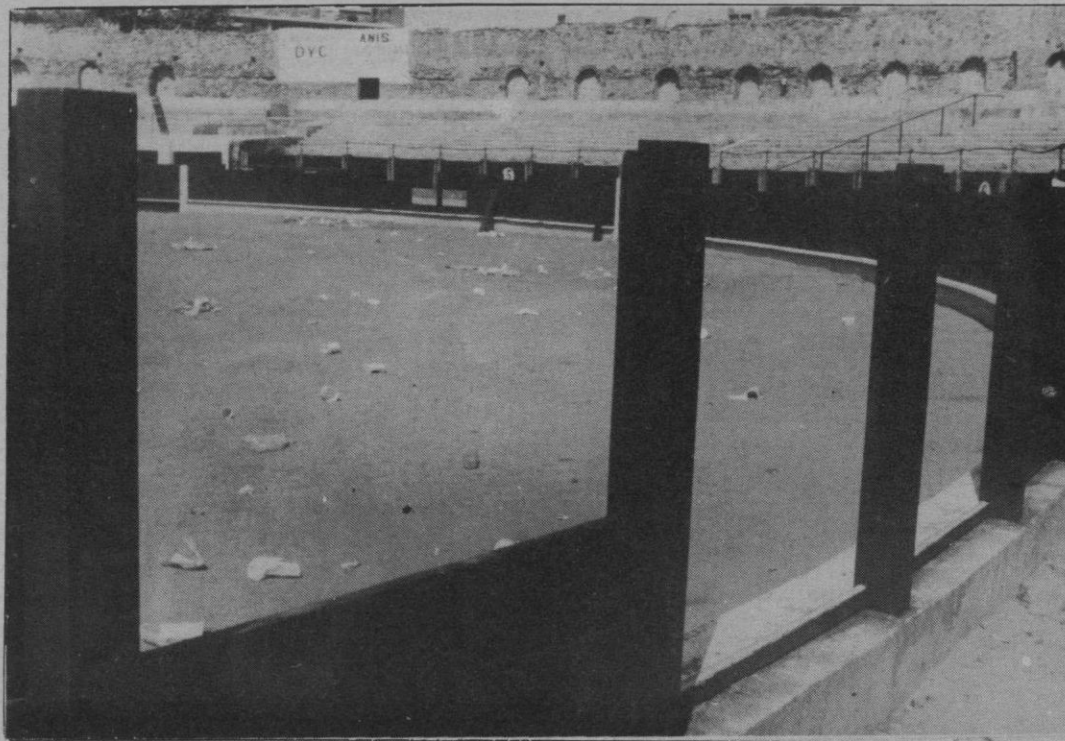
Las tablas del coso fueron descolocadas y partidas