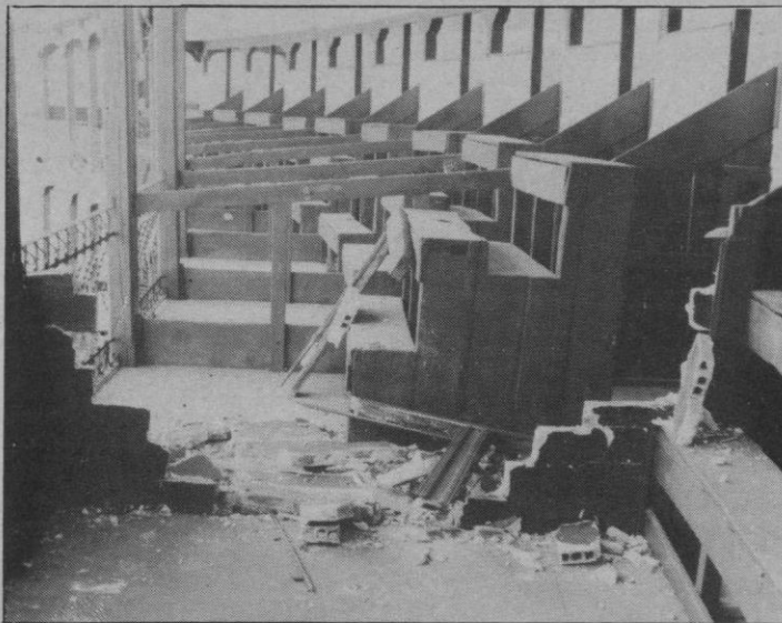
El palco presidencial quedó con graves destrozos