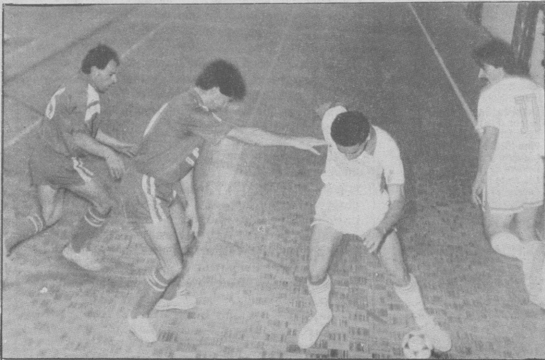
El sala puede cambiar