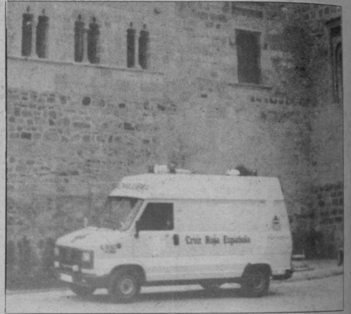
La nueva ambulancia para la Cruz Roja de Santa María de Nieva.

El centro, ubicado en el mismo monasterio de S.ª M.ª la Real de Nieva, ocupa una parte de la Sala Capitular y la Sala de la Reina, habiendo sido restaurado y acondicionado espléndidamente por la Caja de Ahorros de Segovia, entidad que, mediante un acuerdo con el Ayuntamiento, trasladó sus oficinas a un solar próximo recuperando de esta forma una parte importante de la fachada del monasterio que da a la plaza.