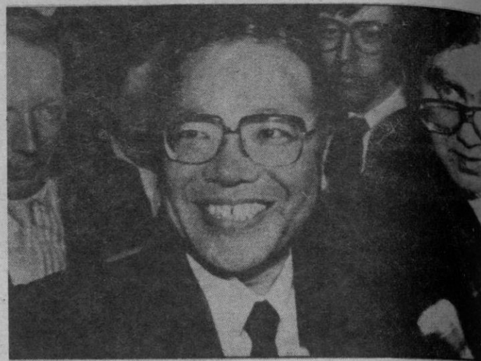
El precio alcanzado por el cuadro de Picasso «Acróbata y joven arlequin» fue ayer el centro de los comentarios en el mundo del mercado del arte. El comprador (en la imagen), un representante de una cadena japonesa de grandes almacenes pagó cuatro mil millones de pesetas por el lienzo. Por su parte, un portavoz de la empresa aseguró que se trata de una inversión rutinaria: un pedido de un cliente

Miguel Boyer tomará posesión de su cargo como presidente de Cartera Central el próximo día 15 de diciembre.— Efe