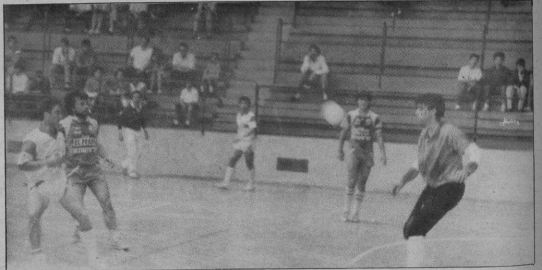
Caja Segovia-Interviú, todo un gran partido

El paréntesis ha sido largo. Desde los últimos días del pasado mes de septiembre no se ha vuelto a disputar ningún encuentro oficial de Liga en la División de Honor de fútbol sala. Ello quizás ha hecho perder el hábito de los aficionados, pero lo que no cabe duda es que cuando el equipo campeón de Liga, Interviú, visita cualquier cancha, siempre hay atractivo más que suficiente para acudir. Mañana se jugará otro de esos encuentros de los que gustan y más aún