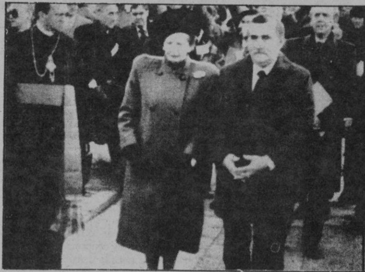
Thatcher y Walesa ante el monumento de las víctimas obreras del 70.

Varsovia.—La primera ministra británica, Margaret Thatcher, fue objeto ayer de un efusivo recibimiento en Gdansk, donde visitó al líder de «Solidaridad», Lech Walesa, al que correspondió con manifestaciones igualmente cálidas de apoyo a «Solidaridad». Unos 10.000 simpatizantes de «Solidaridad» recibieron con vivas y aplausos a Thatcher, el primer jefe de un Gobierno extranjero que visita a Walesa.