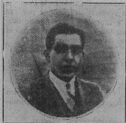
El Presidente de la República del Perú, don Luis Sánchez del Cerro, que ha sido asesinado.