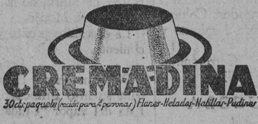
30 ch. paquete (pesa para 4 personas) Flavour: Helado - Natilla - Pistano