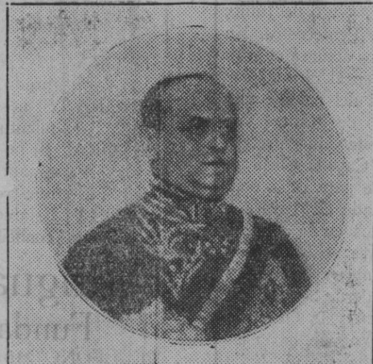
El general don Oscar R. Benavides, nuevo Presidente de la República del Perú.

También se ruega encarecidamente a todos los párrocos o directores del Apostolado que, con toda urgencia procuren notificar al Prior del Santuario de Ntra. Sra. de Lluch el número aproximado de socios correspondientes a su propio grupo.