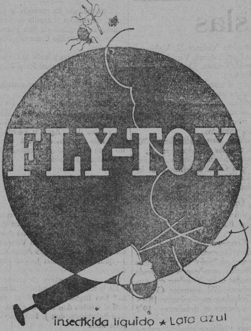
insecticida liquido * Lata azul

ROLDAN Y GAVALDA, S. en C. Córcega, 195 y 197 Teléfono 70051 BARRCELONA