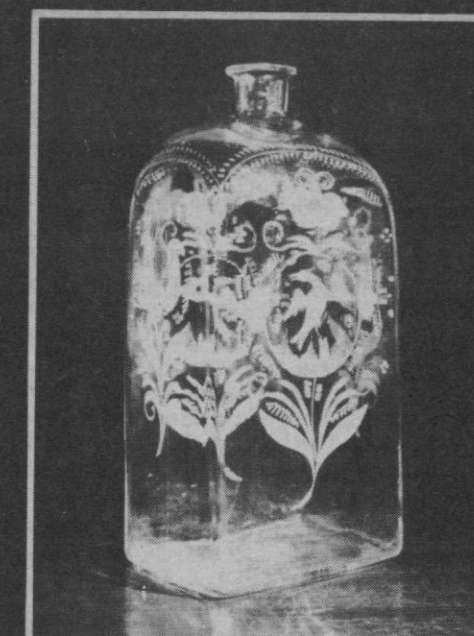
DEL 21 AL 31 DE MARZO DE 1986 Torreón de Lozoya, Plaza de Medina del Campo

Día 21: Inauguración oficial de la VI Feria. Torreón de Lozoya: 12,30 horas. Apertura al público: 13,30 horas.