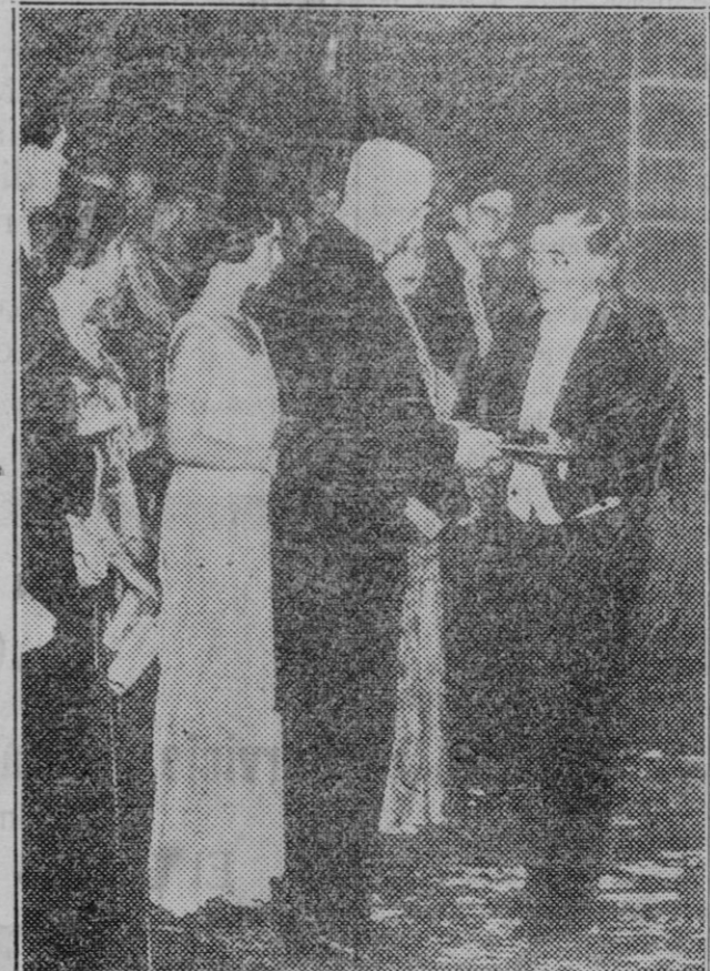
Estocolmo. — El Dr. Irving Langmuir, recibiendo de manos del rey de Suecia el Premio Nobel de Química, que comparte este año con los profesores ingleses Sherrington y Adrian