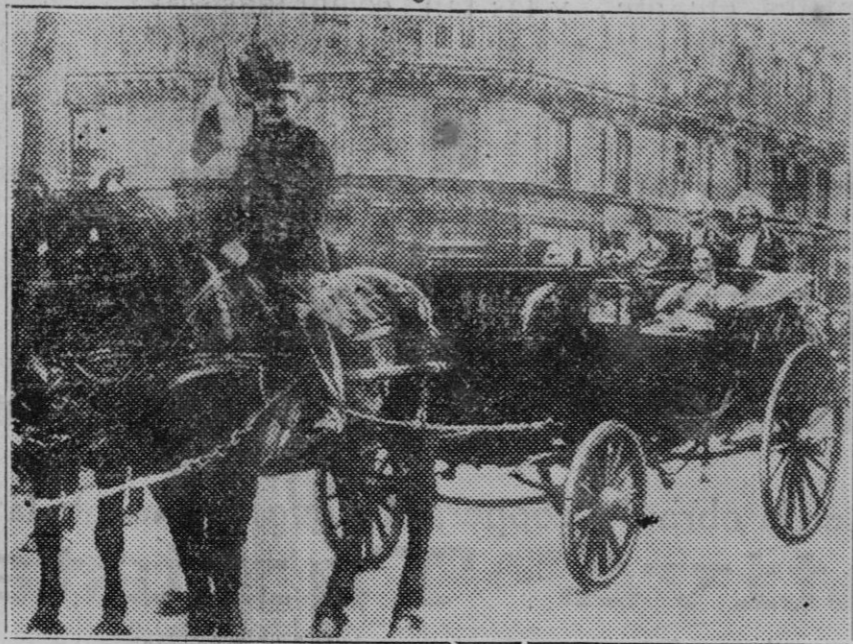
París. — Carroza del emperador Napoleón III y de la emperatriz Eugenia, que figuró en el cortejo que recorrió los grandes bulevares

A las dos de la tarde se celebró el banquete popular organizado con motivo de la clausura del II Congreso de las Juventudes Católicas. Al acto asistieron más de dos mil comensales. A las cinco y media de la tarde comenzó la velada artística que se había anunciado.