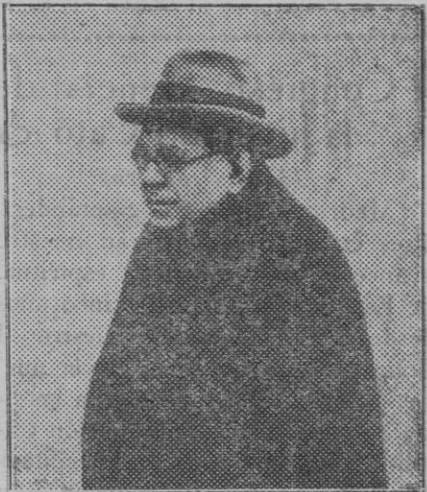
El ilustre compositor catalán don Amadeo Vives, que falleció en Madrid.

Seguidamente, muy complacido nuestro redactor se despidió amablemente del citado Sr. Canónigo y le agradeció sus interesantes manifestaciones.