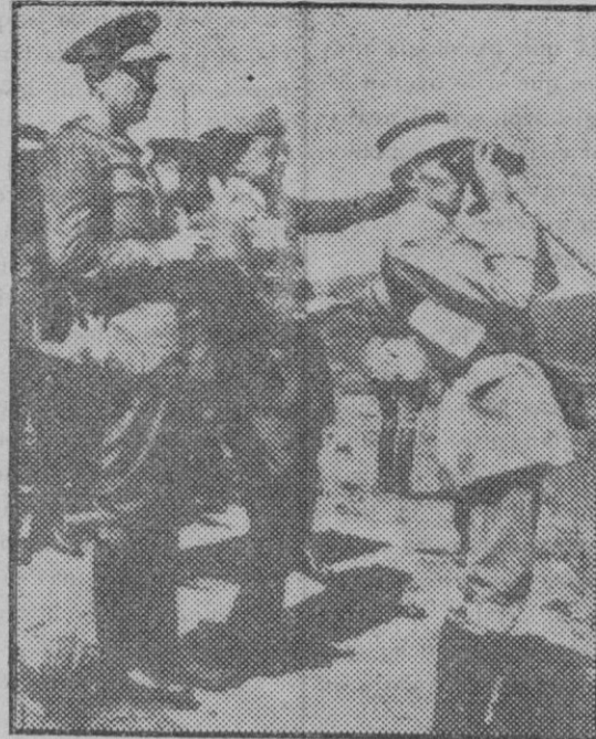
El general Gómez Morato, jefe superior del ejército en Marruecos, presenciando las maniobras con el Estado Mayor y los delegados militares extranjeros que asistieron al táctico militar.

ilustre señor Delegado de Cruzada en facilitar las cantidades disponibles de la predicación de 1930 y a un donativo extraordinario de cinco mil pesetas hecho por persona cuyo nombre puede adivinarse, pero que ruega no se haga público. Significa esto, por desgracia y con harta claridad, que, por la baja enorme de las colectas mensuales, están reducidos los fondos con que cuentan la Junta a una suma apenas apreciable. Con mucho sentimiento, pues, anuncia que, para las necesidades del mes de Octubre, y a menos de algo no previsto, no podrá subvenir atención alguna de Culto y habrá de atender al Clero en la parte alícuota y en la forma equitativa que sus disponibilidades le consentan.