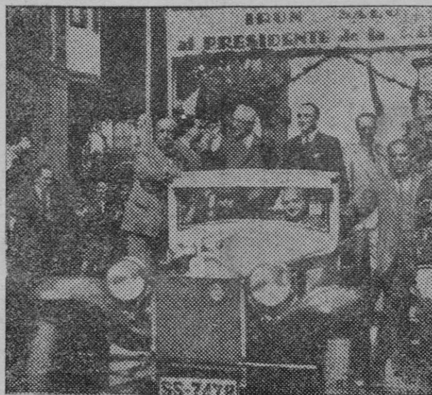
El viaje del Presidente. — El Presidente a su llegada a Irún se dirige al Ayuntamiento.

Gran liquidación de artículos para vestidos, abrigos y mantas de lana.