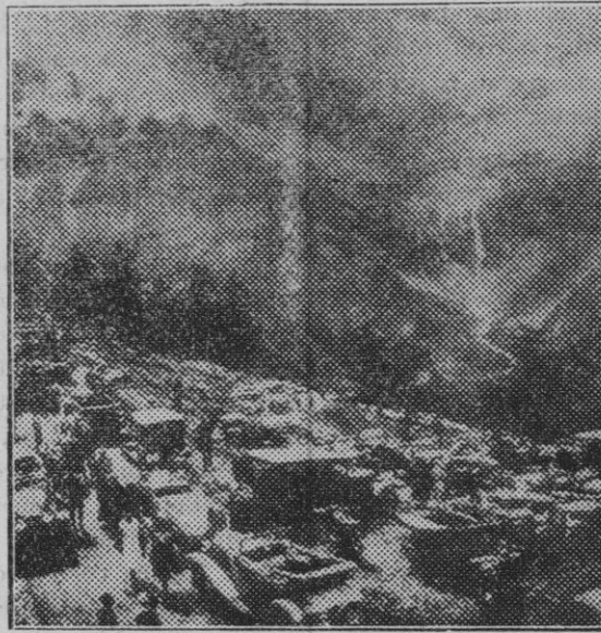
Salzburg (Alemania). — Inauguración de la carretera trazada a través de los Alpes, desde Salzburg a Kärnten para unir el sur de Baviera con el norte de Italia.

Por los Veterinarios señores Piña y Fiol, han sido denunciados a la Alcaldía varios vendedores de leche, por expenderla adulterada. Uno de ellos fué hallado "infraganti", por el señor Piña, en el momento de hacer la entrega a determinado establecimiento.