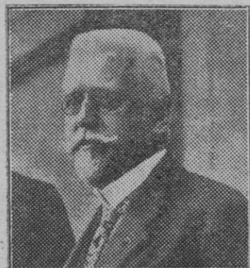
Viena. — M. Scheeber, ex-canciller de Austria, recientemente fallecido.