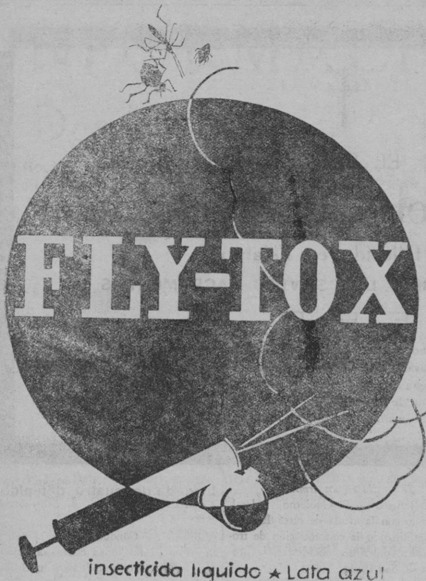
insecticida liquido ★ Lata azul

Se admiten esquelas mortuorias hasta las once de la mañana.