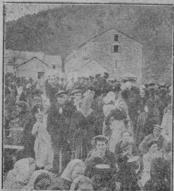
Reunión de Pastores en el Santuario de Nuestra Señora de Nuria (Provincia de Gerona), con motivo de la romería ("aplec") de San Pedro.

Esperamos de los buenos auspicios del presente que el año próximo se repetirá con mayor contingencia, tan atrayente fiesta.