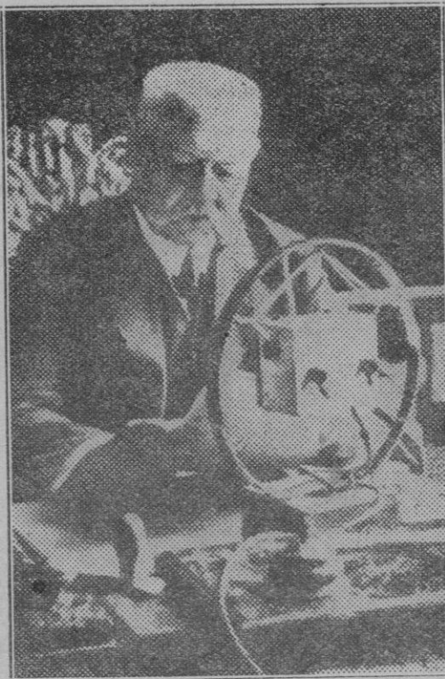
El Presidente Hindenburg dirigiendo por medio de la radio su palabra a los alemanes en vísperas de las elecciones.

Corredor de Comercio Colegiado Baratillo, 15 Telf. 2267