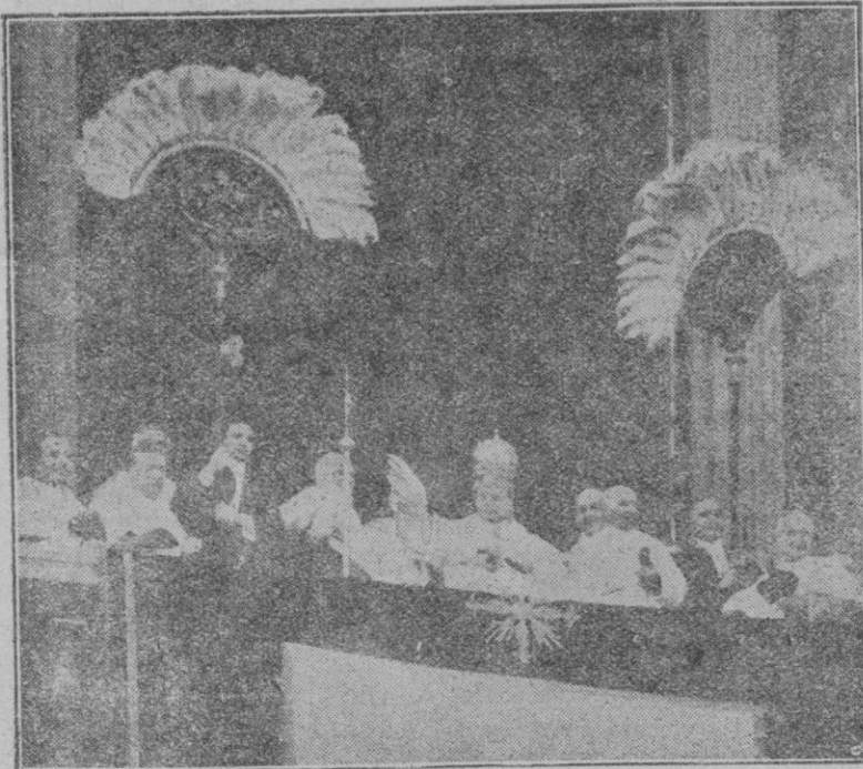
Momento en que S. S. Pio XI dió la bendición en el día de su coronación.

Mas Pio XI ha juzgado deber suyo el denunciar ciertas escuelas y uniones políticas a medida que se oponían a la doctrina de la Iglesia, ya sea condenando la "Acción Française", ya sea en Italia con la valiente publicación de su Encíclica sobre la Acción Católica en el pasado Julio: por ningún motivo habría dejado Pio XI de cumplir su deber. Además fué necesario toda su heroica fuerza de ánimo, que le asemeja a Gregorio VIII, para levantarse ante los poderes civiles, elevar su voz y protestar energicamente hasta que fueran restablecidas la justicia y la paz. Pio XI es pues, con todo derecho y su máximo grado el Papa de la Acción Católica.