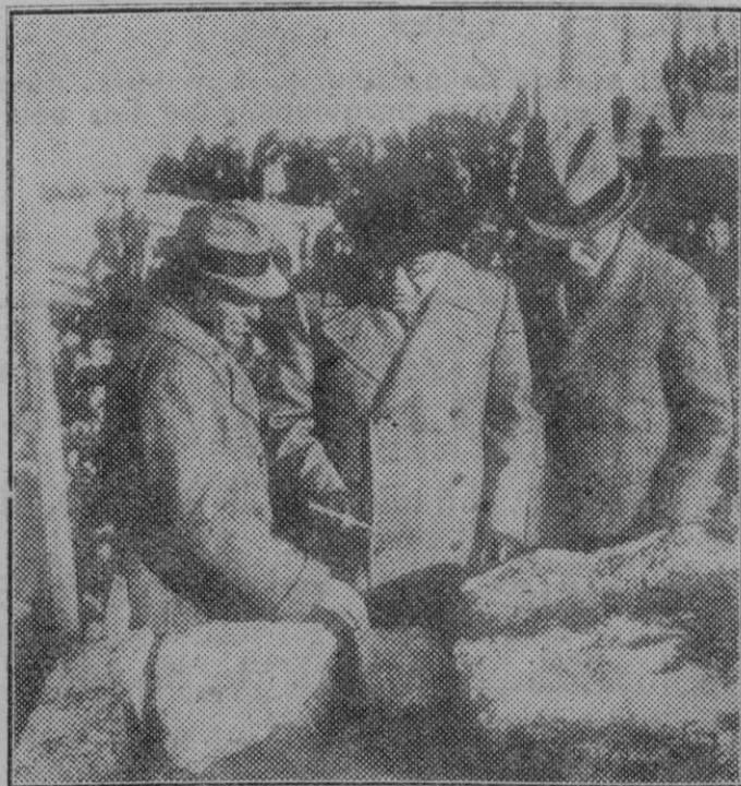
Gerona. — El señor Azaña, acompañado del presidente de la Generalidad y del alcalde de la ciudad, tirando la primera piedra del Baluarte de Santa Catalina.

Reposición de la obra "El Caballero de media noche".