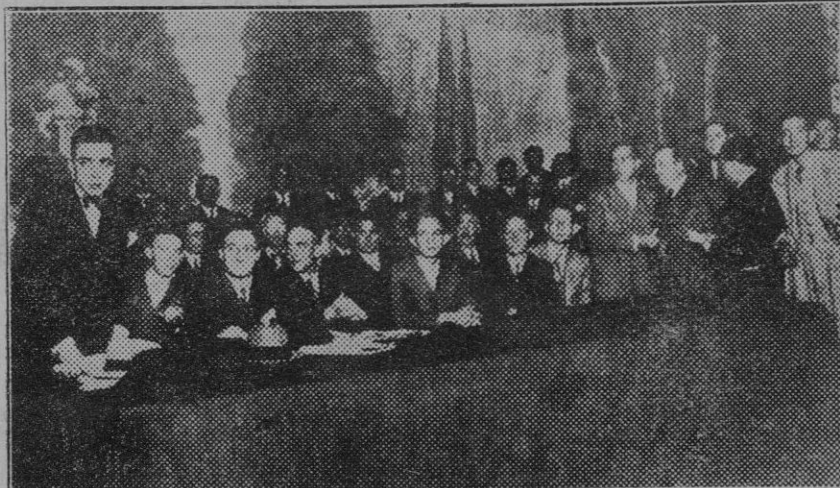
Barcelona. — La presidencia del mitin en el Teatro del Bosque, organizada por la Federación de Estudiantes Católicos, en pro de la libertad de enseñanza.

En cuanto a las huelgas de Alaró e Inca tenía ayer muy buenas impresiones.