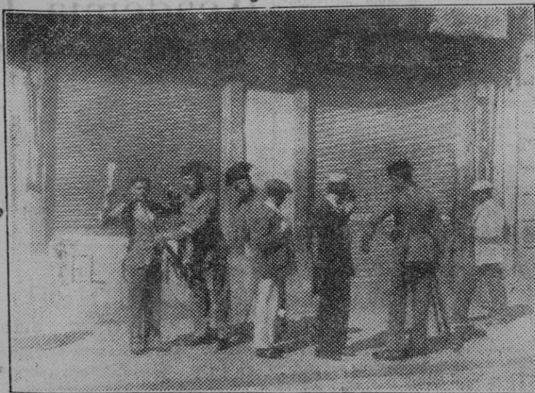
Granada. — La guardia civil cachando a los huelguistas.

Ayer tarde, el Baleares se trasladó a Lluchmayor, con objeto de jugar un encuentro con el titular de dicha ciudad. La victoria la obtuvieron los baleári-