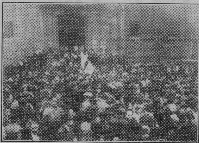
Bilbao. — El Centro Aragonés, de Bilbao, al salir de la iglesia de San Nicolás, donde celebró la fiesta de la Virgen del Pilar la colonia aragonesa.