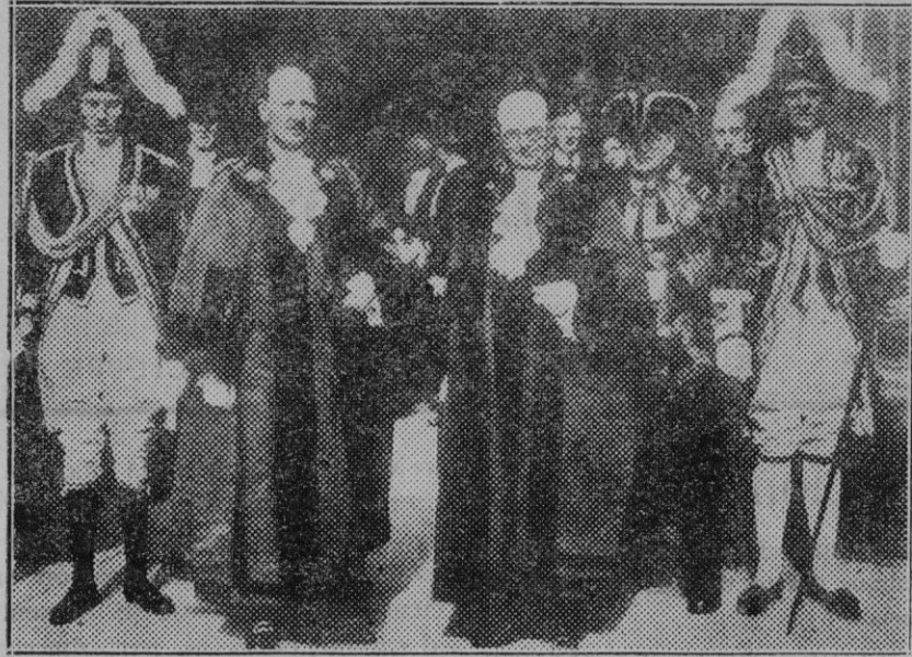
Londres. — Los nuevos jueces de la capital de Inglaterra, saliendo de prestar juramento ante el más alto magistrado de la nación.

3.º Necesidad de la Fe: la proclaman el mismo Cristo: "El que creyere, será salvo; el que no creyere, se condenará"; el apóstol San Pablo: "Sin fe es imposible agradar a Dios"; el Concilio Tridentino: "La fe es el principio de la salvación del hombre, el fundamento y raíz de toda justificación", etc.