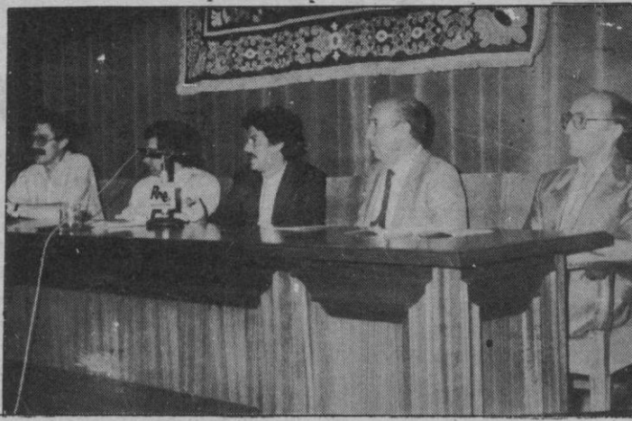
La presidencia en la inauguración del Encuentro.