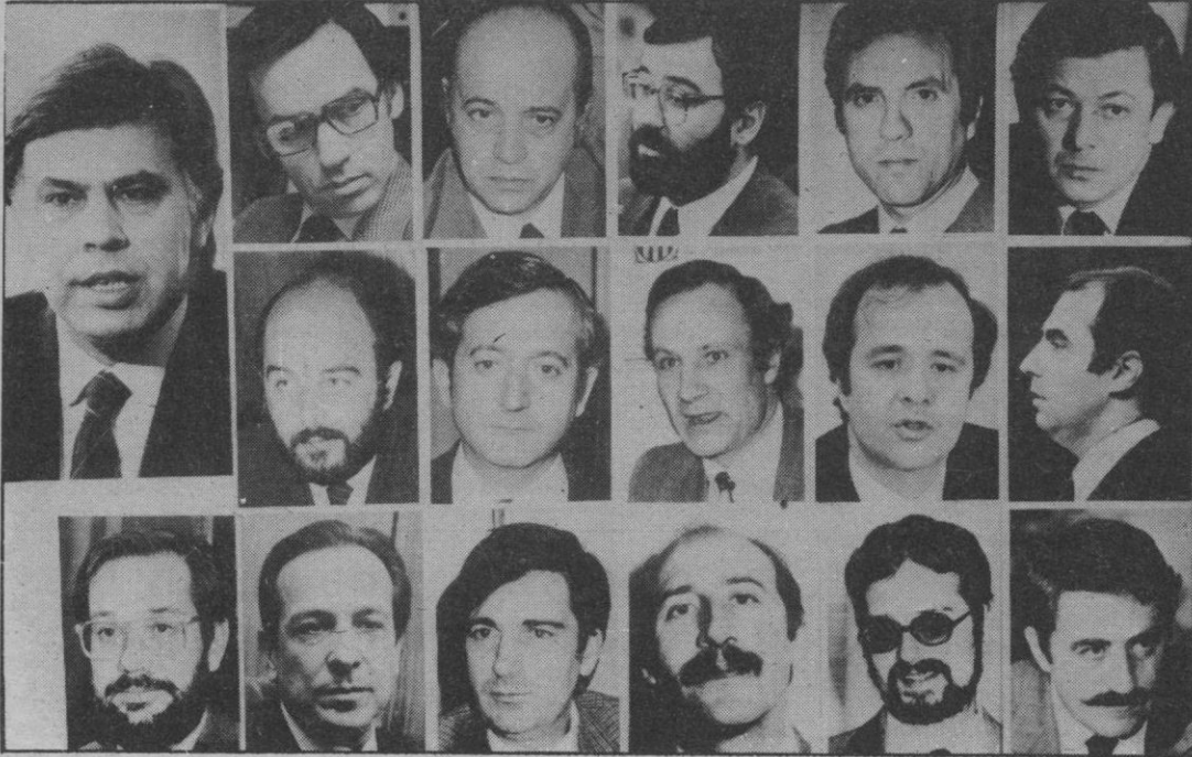
Nuevo Gobierno español.—(De izquierda a derecha y de arriba a abajo): Felipe González, presidente del Gobierno; Alfonso Guerra, vicepresidente; Francisco Fernández Ordóñez, ministro de Asuntos Exteriores; Narcís Serra, ministro de Defensa; José Barrionuevo, ministro del Interior; Carlos Solchaga, ministro de Economía y Hacienda; Joaquín Almunia, ministro de Trabajo; Javier Moscoso, ministro de la Presidencia; Joan Majó, ministro de Industria y Energía; José María Maravall, ministro de Educación; Félix Pons Irazábal, ministro de Administración Territorial; Javier Solana, ministro de Cultura y portavoz del Gobierno; Fernando Ledesma, ministro de Justicia; Ernest Lluch, ministro de Sanidad; Javier Sáenz de Coscolluela, ministro de Obras Públicas y Urbanismo; Abel Caballero, ministro de Transportes y Comunicaciones; Carlos Romero, ministro de Agricultura.

Objetivo: Oxigenar y dar impulso a la acción de Gobierno; BOYER: «El quiso ser sustituido»