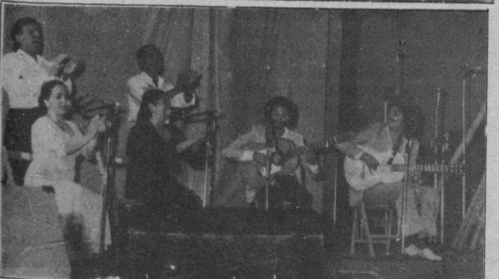
Los tres grupos que actuaron anoche: La Retahila, Mosaico y Familia Montoya.