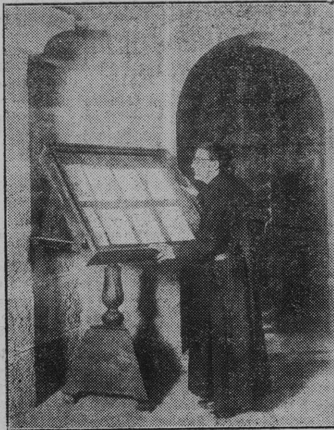
Barcelona. — Una muestra de la Exposición del Libro Monserratino que se inauguró el domingo.