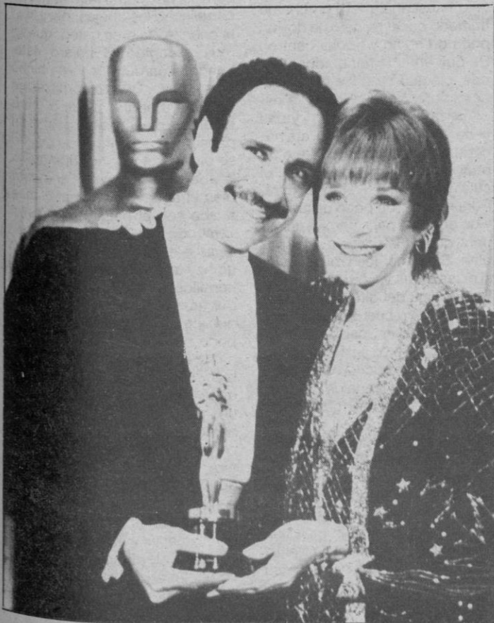
LOS ANGELES (EE.UU.).— La actriz Shirley McLaine, hizo entrega del Oscar al mejor actor a F. Murray Abraham (izquierda), por su papel en «Amadeus» como el compositor Salleri.— (Telefoto Efe-Ap)

El atentado tuvo lugar cuando un encapuchado penetró con armas en el bar «Víctor», situado en la plaza del frontón, habitualmente frecuentado por refugiados vasco españoles. El hombre hizo varios disparos, mientras poco después una segunda persona — identificada como una mujer — lanzó un artefacto explosivo en el bar.— Efe