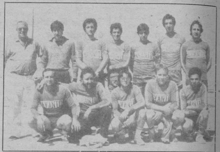
Avanto Santa María: De nuevo líder

El exceso de original hizo que la pasada jornada no tuviera eco en estas páginas. Pero los encuentros sí se disputaron, por lo que ofrecemos sus resultados: