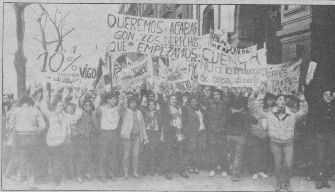
Como ayer informábamos, profesores de EGB (diplomados en Magisterio) de la promoción de 1984 se manifiestan ante el Ministerio de Educación, en Madrid, por la reducción al 2% del número de los mismos que tendrá acceso directo al puesto de trabajo y en reivindicación de un 10% como en años anteriores.

LA REINA ISABEL de Gran Bretaña, en su segundo día de visita a Portugal, recibirá hoy al primer ministro, Mario Soares.