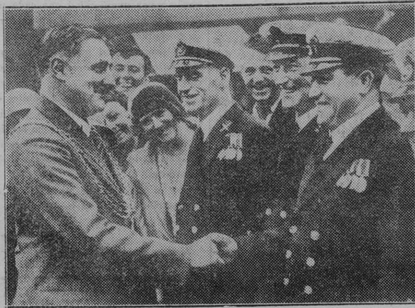
Plymouth (Inglaterra). — Los supervivientes de la tripulación del submarino "Poseidon", perdido en aguas de la China, son saludados por el alcalde de Plymouth, a su llegada a Inglaterra.