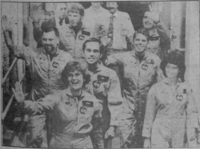
Los siete miembros de la sexta misión del Challenger, en el momento de abandonar la base espacial de Cabo Cañaveral para llevar a cabo la «misión histórica» de ocho días.

Houston (EE.UU. — Los siete astronautas que viajan a bordo del transbordador espacial «Challenger», en su jornada inaugural de un vuelo programado de ocho días, se encontraron con los primeros problemas técnicos que retrasaron tres horas el lanzamiento del satélite.