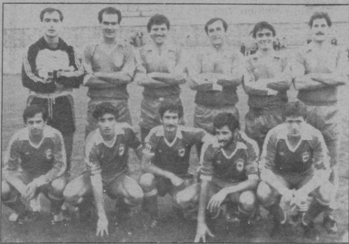
Real Avila: Un fuerte rival

Ya son cinco las jornadas de competición oficial que se han disputado en el calendario de la tercera división. En el fin de semana presente se disputa la sexta que reúne éstos encuentros: