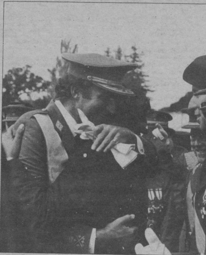
Madrid.— El Rey don Juan Carlos presidió, en el acuartelamiento de la Guardia Real de El Pardo, los actos conmemorativos de las bodas de plata de la 14 promoción de Infantería. En la foto, don Juan Carlos abraza a un compañero de promoción

En la estación de León, los Reyes inaugurarán una exposición organizada por la Renfe con diverso material moderno de trenes de viajeros.— Efe