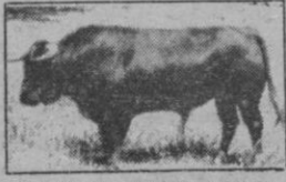
N.º 41: BARQUILLOSO, negro zaíno