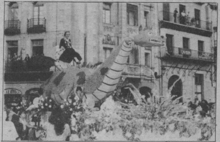
La carroza ganadora

4, pabellón del INB «Andrés Laguna», tenis de mesa organizado por la Federación Provincial.