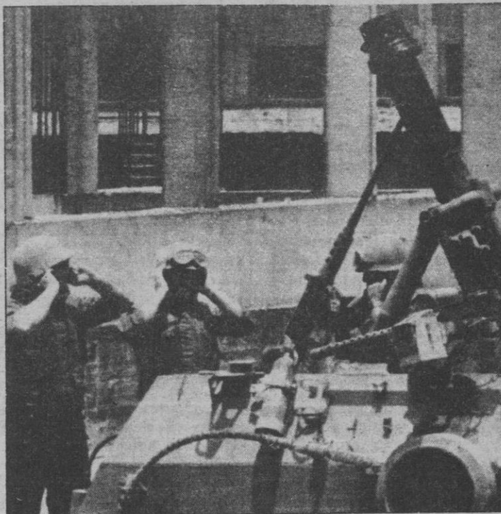
Un mortero israelí de 160 milímetros bombardea el sector occidental de Beirut

Beirut.—La firme decisión israelí de expulsar de Líbano a la Organización para la Liberación de Palestina (OLP), cuya plana mayor se encuentra atrinchera y cercada en el oeste de la capital, puede desembocar en una solución diplomática o en la ocupación de Beirut por el