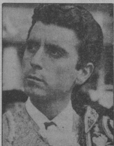
JOSE ORTEGA CANO