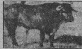
N.º 49: ORADOR, negro entrepelao