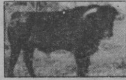
N.º 42: MADROÑERO. Negro bragao