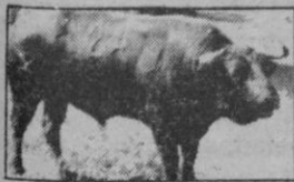
N.º 24: VIOLENTITO. Negro mulato