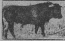
N.º 46: PECADOR, negro entrepelao