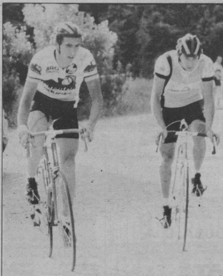
A la derecha, el vencedor