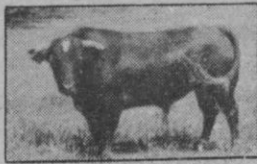
N.º 28: BELENITO, negro lucero, bragado