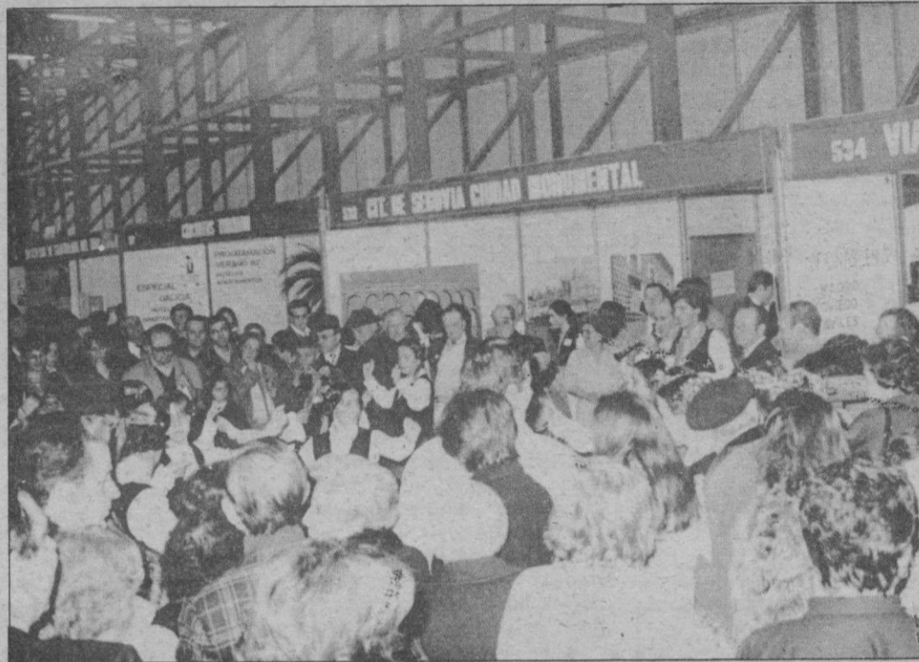
En la Feria Internacional de Turismo (FITUR-82) se celebró ayer, como estaba anunciado, el «Día de Segovia», hecho que concentró gran atención de los visitantes de la Feria hacia el stand segoviano, montado por el Centro de Iniciativas Turísticas. También estuvieron presentes las primeras autoridades y otras personalidades de nuestra provincia.

Junto a las primeras autoridades, asistieron numerosas personas