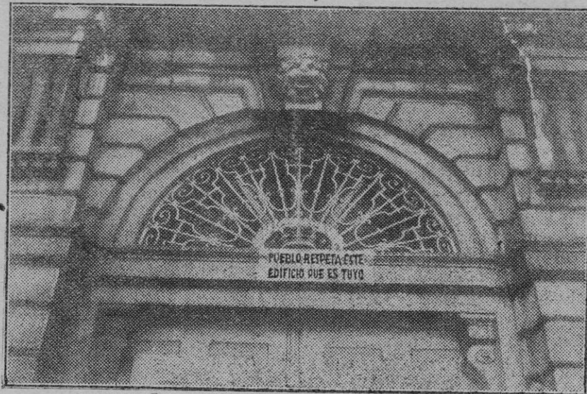
Cartel colocado por el Gobierno provisional de la República a la puerta del Palacio Real para evitar posibles atentados contra éste edificio monumental e histórico.

Manifestó que el pueblo español pasaba por unas circunstancias únicas en su historia y tal vez, añadió