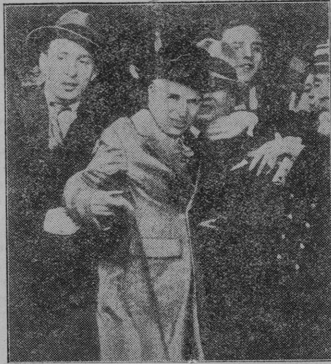
París. — El popular actor cinematográfico "Charlot", es aclamado por el público que le esperaba a su llegada a la capital de Francia.