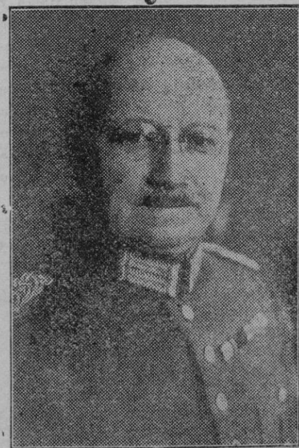
Berlín. — El coronel Lutz que ha sido nombrado inspector de transportes de tropas, en sustitución del teniente general von Stülpnagel.

Primer distrito. — Casa Consistorial, comprendiendo las secciones tituladas