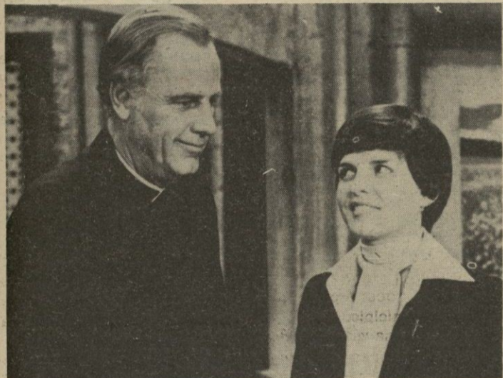
Los personajes principales están interpretados por McLean Stevenson, como el padre Daniel M. Cleary, y Priscilla López en la hermana Aggie

Recoge la misión de dos religiosos en un suburbio