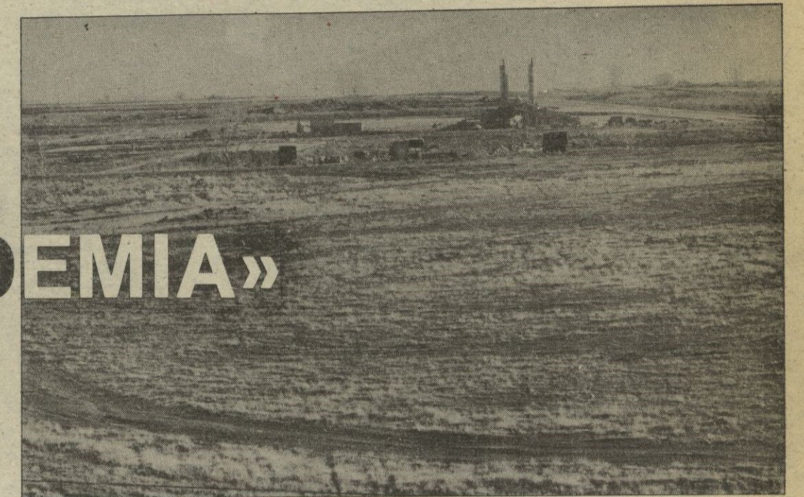
Este es el lugar que, de llegarse a un acuerdo, podría destinarse a campo de tiro. Al fondo, las obras de construcción en el polígono residencial «Nueva Segovia»

Uno de los problemas que existen en la ciudad y que debe de solucionarse a corto plazo es el de la ubicación del campo de prácticas de tiro y la consiguiente permanencia de la Academia de Artillería en Segovia.