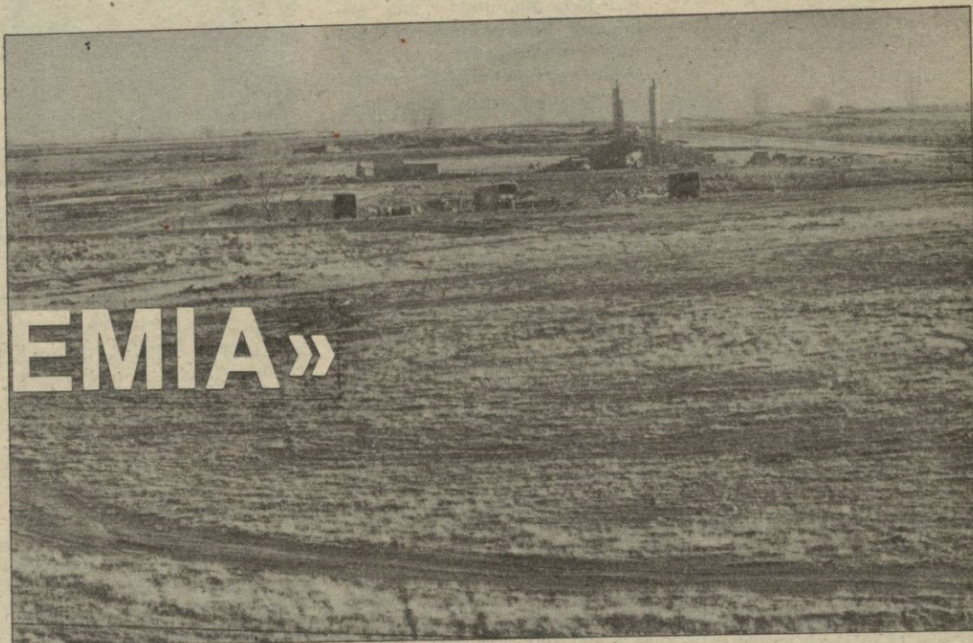
Este es el lugar que, de llegarse a un acuerdo, podría destinarse a campo de tiro. Al fondo, las obras de construcción en el polígono residencial «Nueva Segovia»

Uno de los problemas que existen en la ciudad y que debe de solucionarse a corto plazo es el de la ubicación del campo de prácticas de tiro y la consiguiente permanencia de la Academia de Artillería en Segovia.