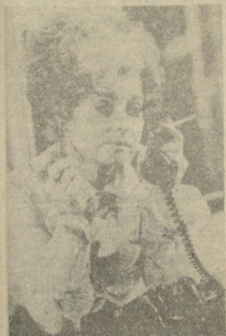
Fruella sea'es incorporada a la encantadora Sybil Fawcety.