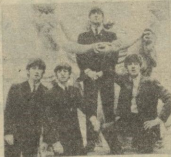
Entre otras, se ofrecerán actuaciones de: Muddy Waters, The Beatles, Chuck Berry, Janis Jo-