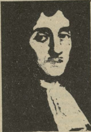
El inmortal dramaturgo francés Jean Racine.

Nerón, que bajo actitudes todavía virtuosas empieza a revelar su indole cruel, ha hecho secuestrar en su palacio a Juno, descendiente de Augusto, sustrayéndola al amor de Británico. Su madre, Agripina, que en favor de Nerón había sacrificado el derecho preferente de Británico, hijo