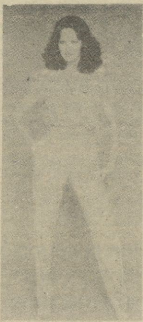
La bellísima Kelly (Jaclyn Smith)