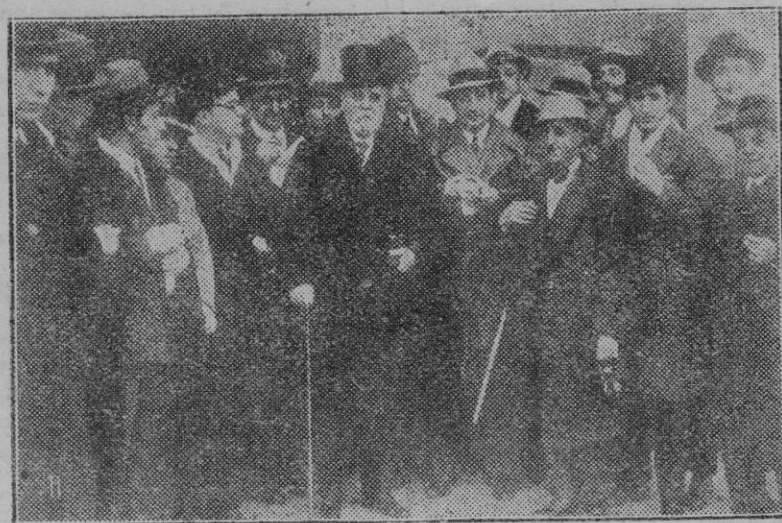
1 El Sr. Conde de Romanones, al salir de Palacio, después de ser consultado por el Monarca. 2 Don José Sánchez Guerra, después de ser consultado por el Monarca sale de Palacio, de donde estuvo alejado los ocho últimos años.