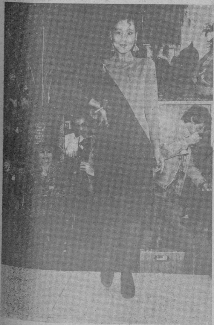
Bicolor y asimétrica son dos tendencias para el invierno 79-80. Aquí, en tricot de pura lana virgen un vestido de Vakko.

A pesar de sus notables efectos, las mascarillas de Juvena no contienen ningún ingrediente nocivo. Sus componentes han sido cuidadosamente seleccionados y han pasado pruebas de laboratorio muy estrictas, pudiéndose usar de 1 a 3 veces por semana sin crear problema alguno y dependiendo del tipo de mascarilla.