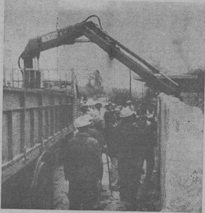
El Ayuntamiento de Vigo es drástico: Edificio construido sin permiso, derribo con grúa. Y aquí se ve la muestra.

De todas formas, hay que pensar que el Ayuntamiento segoviano, aunque