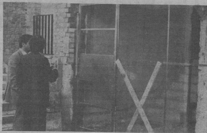
Ante uno de los portales en el polígono Mirasierra.

El próximo día 26 va a dar comienzo un nuevo cursillo para parejas de novios que estén próximas a casarse. Está organizado, como es habitual, por el Movimiento Familiar Cristiano y se celebrará en el colegio de MM. Concepcionistas, hasta el día 1 de diciembre, inclusive. La sesión de cada jornada se iniciará a las 8,30 de la noche, interviniendo sacerdotes, médicos y matrimonios. Nuevos cursillos se celebrarán en febrero, mayo y septiembre del próximo año.